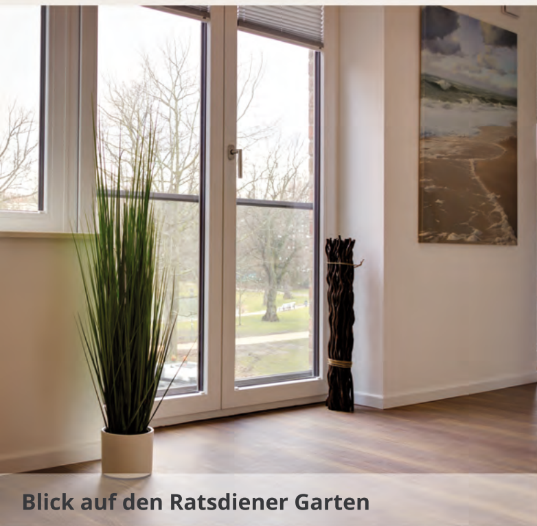
Blick auf den Ratsdiener Garten